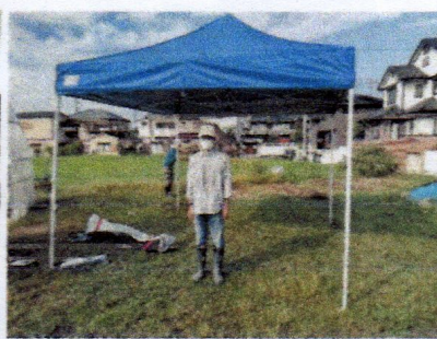
イベント用テント